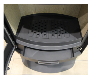
Tiroir cendrier indépendant