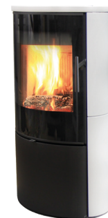
Céramique blanc mat