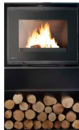
OPTION SOCLE BÛCHER avec double compartiment